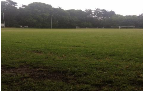
Aktuelles Bild vom Platz